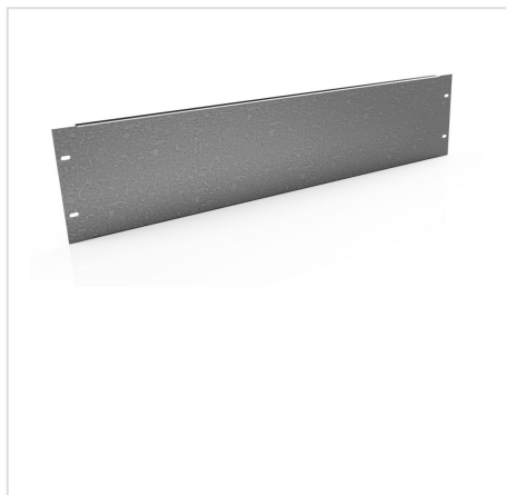
PUA płyta montażowa uniwersalna