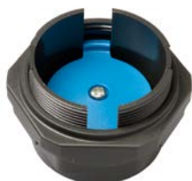
Foto: Wygląd wewnętrzny